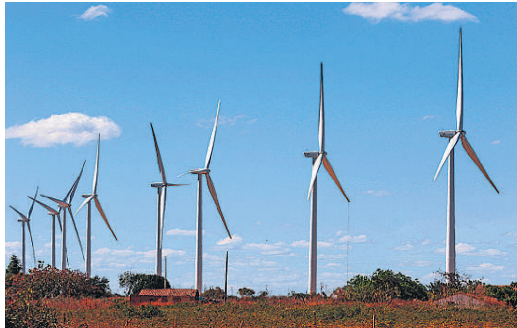
NORDESTE Sistema de alta pressão gerou ventos mais fortes na Bahia, Piauí e em Pernambuco

Paralisada há cinco anos, a mineração de urânio será retomada no Brasil em 2020, afirmou o ministro de Minas e Energia, Bento Albuquerque, que trata o assunto como prioridade.