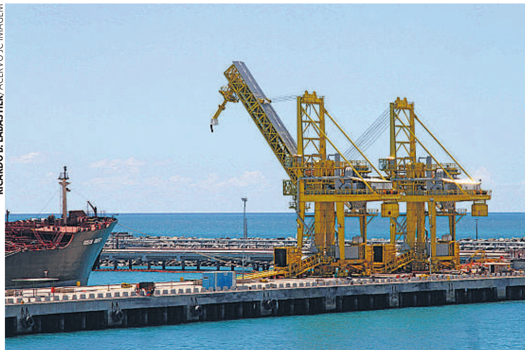
RUIM De 13 setores, sete apresentaram queda em Pernambuco. Construção naval recuou 74,5%

“O freio nas exportações para o país fez com que alguns setores diminuíssem a produção, a exemplo dos produtos químicos, borrachas e plásticos. No ano passado, o desempenho desses segmentos estava bem melhor, enquanto este ano se percebe uma queda nas vendas externas e na pro-